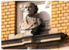
Samuel Friedrich Hahnemann

Das Prinzip der kreativen Homöopathie: „Gleiches mit Gleichem behandeln.“ Das bedeutet, wir können ein altes „Trauma“ aus der Kindheit mit den dazugehörigen Emotionen noch einmal bewusst durchleben und fühlen, um das Resonanzfeld zu neutralisieren. Damit ist das Trauma erlöst. Wir erreichen damit eine andere Schwingung in unserem Körper. Die negative Schwingung ist neutralisiert, und wir ziehen automatisch neue positivere Schwingungen in unsere Lebenssituationen. Wir können noch so viele chemische Medikamente in uns reinfüllen, wenn wir unsere eigenen Energien und Resonanzfelder nicht neutralisieren und verändern, verändert sich auch in unserem Leben nichts.